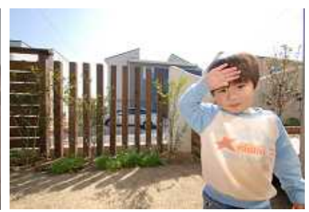
ほくのお庭へようこそ!